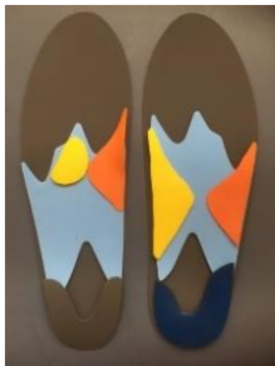
変形膝関節症インソール