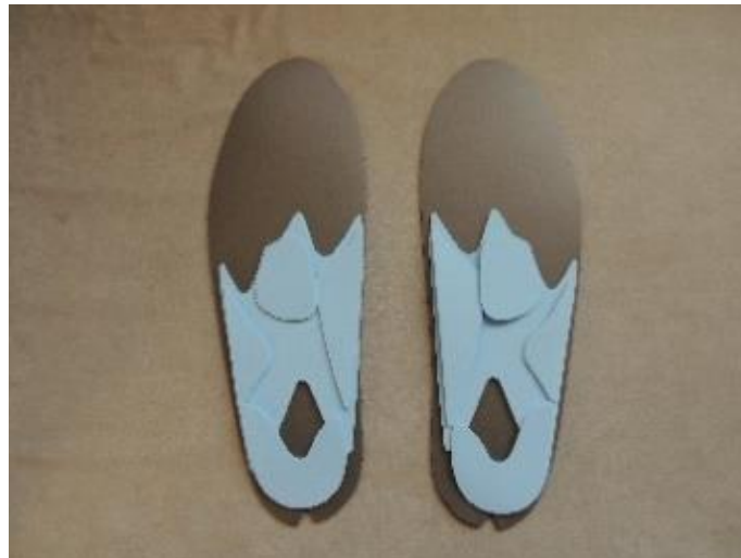
外反母趾インソール